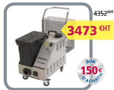
Réf. : FR15005630 SV 8000