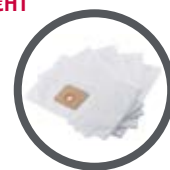
Lot de 5 sacs poussières synthétiques