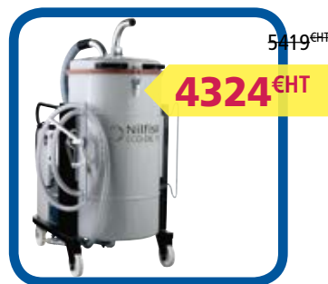
Réf. : 302002900 ATTIX 961-01 PC