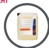
SUPERPLUS 10 L Shampooing carrosseries et moteurs