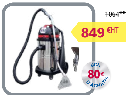
Réf. : 50000209 CAR275 METAL