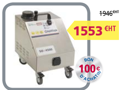
Réf. : FR15005629 SO 4500